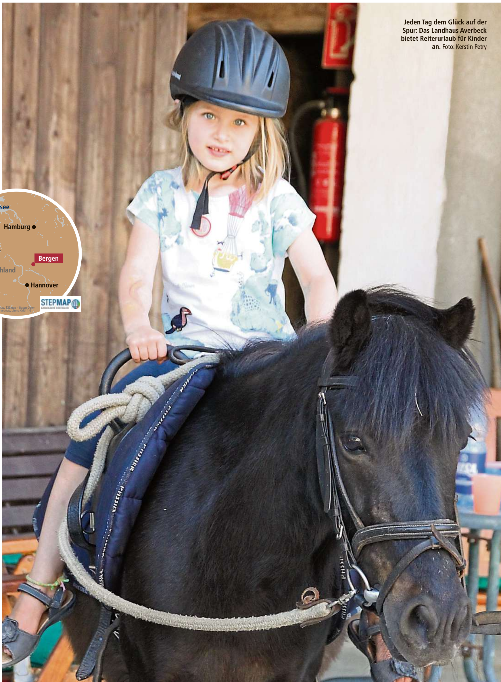
Jeden Tag dem Glück auf der Spur: Das Landhaus Averbeck bietet Reiterurlaub für Kinder an.