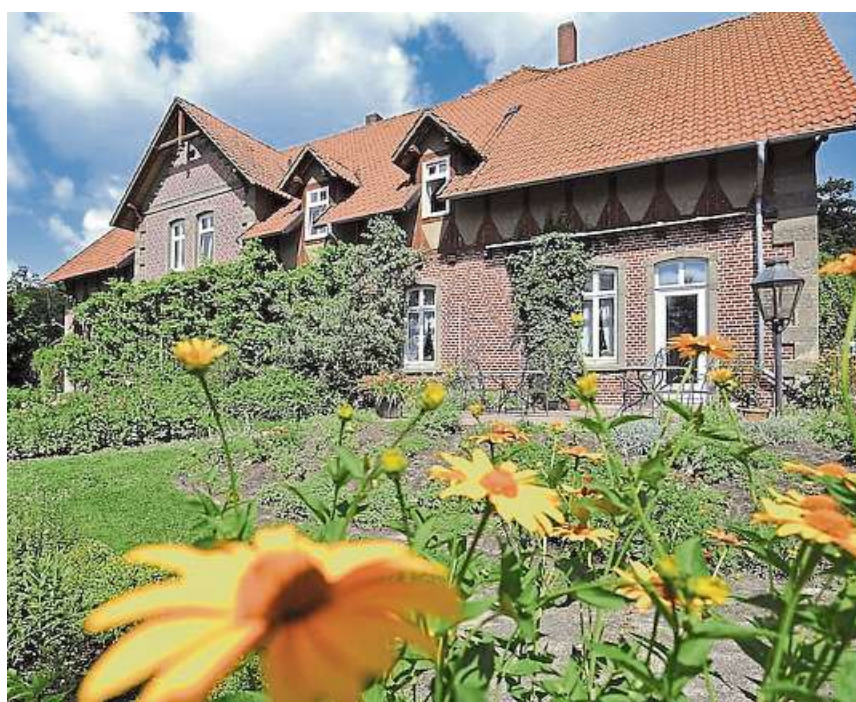
Das Haupthaus mit Rezeption, Billard- und Spielzimmern trägt der Historie des Bauernhofs Rechnung. Er wurde als Hofställe Hassel bereits 1357 urkundlich erwähnt.