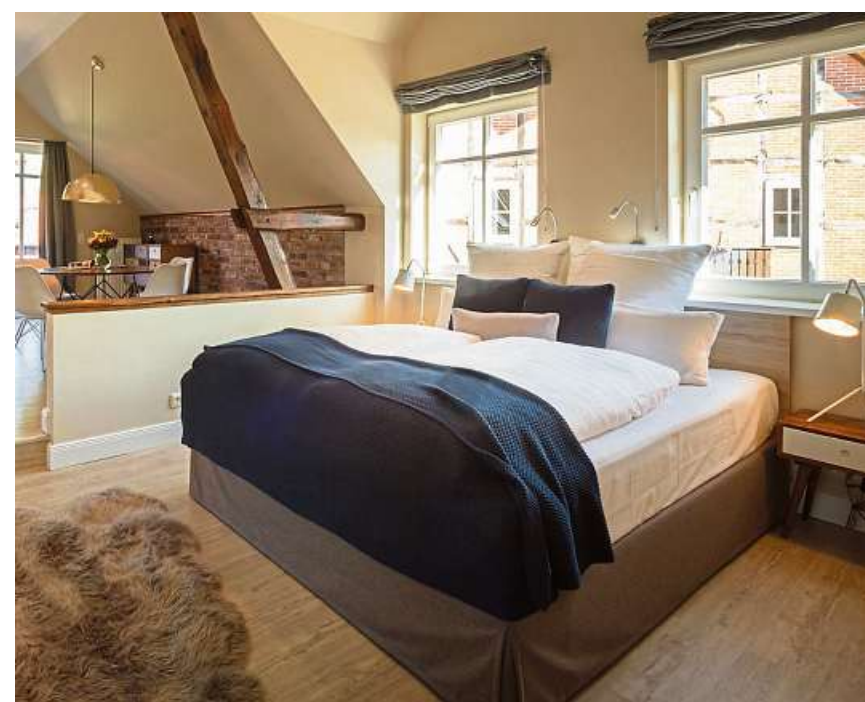
Das Apartment im ehemaligen Schweinestall ist gemütlich und modern eingerichtet. Eigentlich viel zu schade, um nur darin zu schlafen.